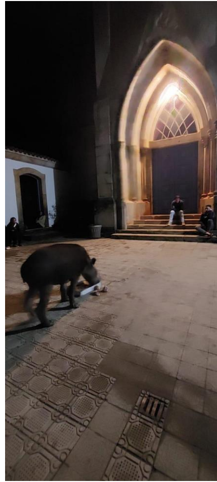
Observação – anta Data: 20/12/23