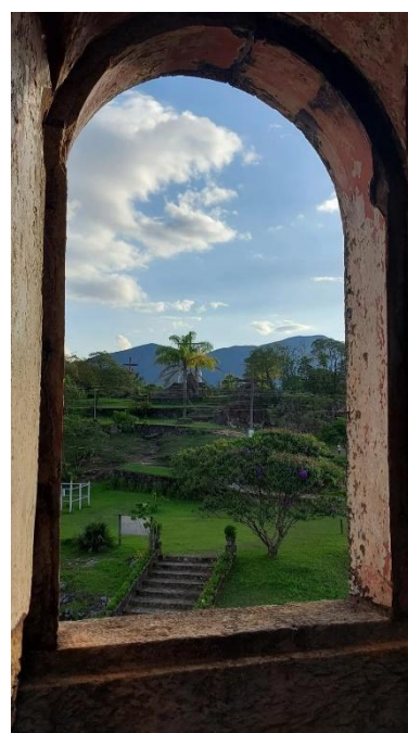
Vista de uma das janelas do Museu do Colégio Data: 20/12/23