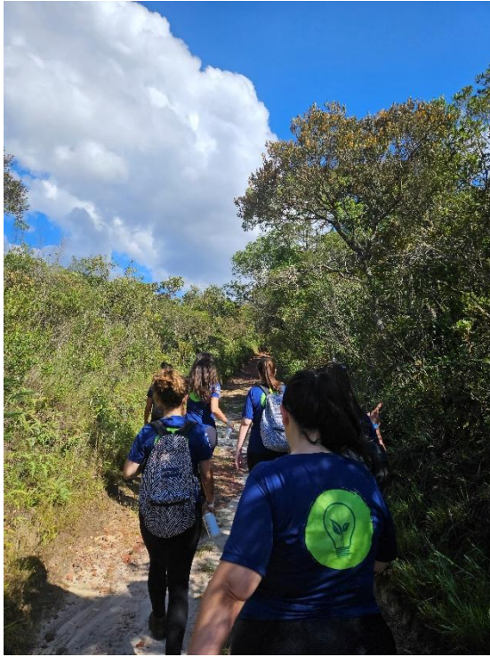
Equipe do Semente em trilha na RRPN Caraça Data: 20/12/23