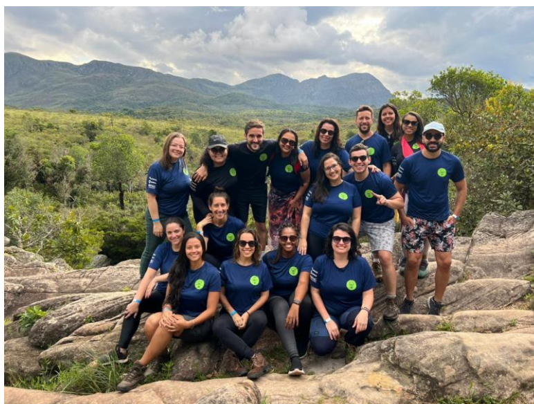
Equipe do Semente em trilha na RRPN Caraça Data: 20/12/23

Ao retornar da trilha, o grupo fez uma breve visita ao Museu do Colégio, montado com peças de mobiliário e artefatos de propriedade do próprio Caraça. O Museu foi implantado na edificação que abrigou o Colégio do Caraça até 1968, quando o prédio foi acometido por um incêndio. Desde então, a instituição de ensino foi desativada.