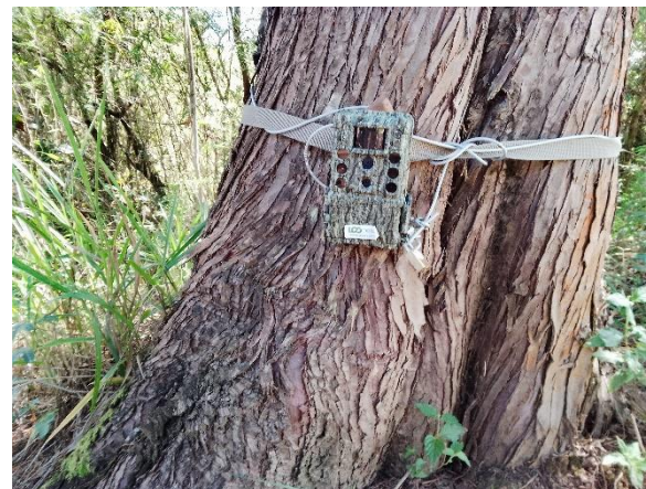
Câmera trap Data: 20/12/23