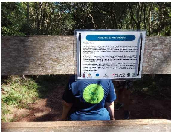
Placa com informações sobre o projeto Autoria: Lucas Rodrigues Data: 20/12/23