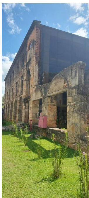
Edificação do Museu do Colégio Data: 20/12/23

Ao retornar da trilha, o grupo fez uma breve visita ao Museu do Colégio, montado com peças de mobiliário e artefatos de propriedade do próprio Caraça. O Museu foi implantado na edificação que abrigou o Colégio do Caraça até 1968, quando o prédio foi acometido por um incêndio. Desde então, a instituição de ensino foi desativada.