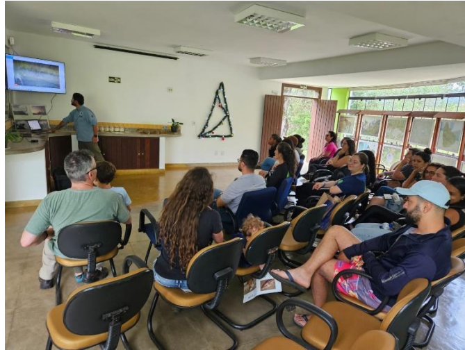
Observação – anta Autoria: Lucas Rodrigues Data: 21/12/23