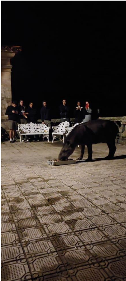
Observação – anta Autoria: Maria Letícia Ticle Data: 20/12/23

Após o jantar, a equipe participou da observação ao lobo-guará, que acontece diariamente durante a noite e madrugada em frente ao Santuário. Na ocasião, o lobo-guará não se aproximou dos visitantes, mas pudemos observar outro animal pertencente à fauna local, a anta, maior mamífero terrestre da América do Sul. Segundo Douglas, é mais raro que a anta apareça no momento de observação do que o próprio lobo-guará.